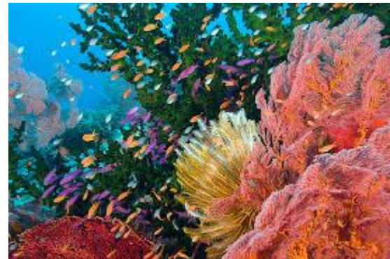
Haremos submarinismo en Vanua Levu