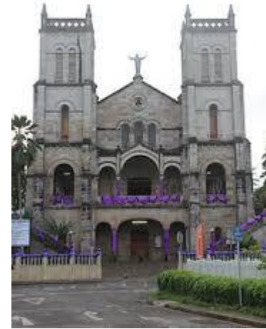
La Catedral del Sagrado Corazón en Viti Levu