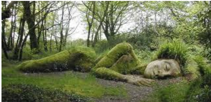
Garden of the sleeping giant en Viti Levu