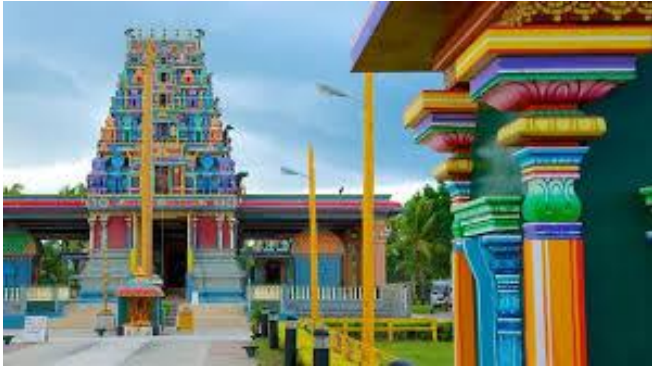
Sri Siva Subramaniya Temple en Viti Levu