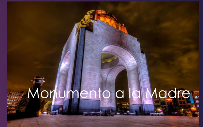
Monumento a la Madre