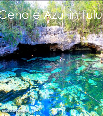
Cenote Azul in Tulum